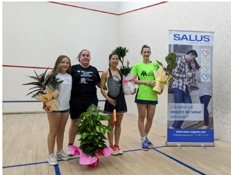
Fotos: La apertura del VI Open Ladies Squash Valencia 2023 y las ganadoras