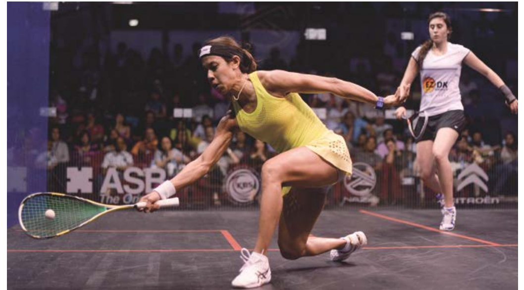
En la foto: Nicol David de Malasia, era una de las mejores jugadoras del mundo.

Mientras tanto, seguimos promoviendo el squash en el colectivo femenino, alentando a mujeres jugadoras de todos los niveles a practicar este deporte.